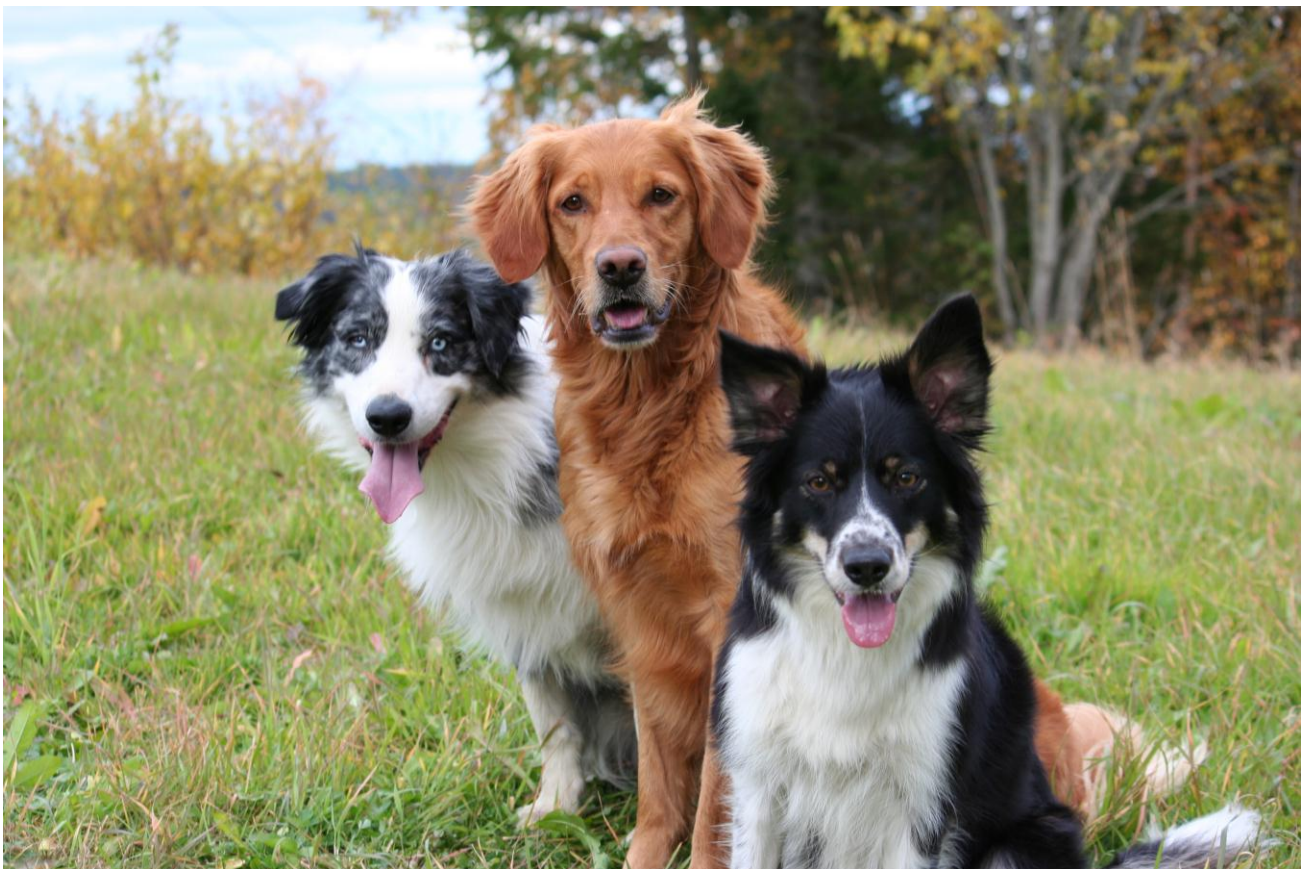
Arox, Easy og Bea