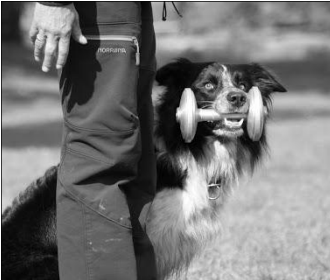
TinTin med metallapporten, klar for avlevering