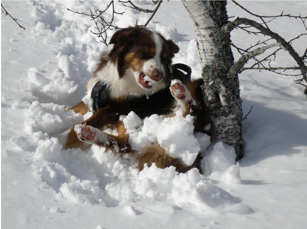
Busy v/Rita Thobroe