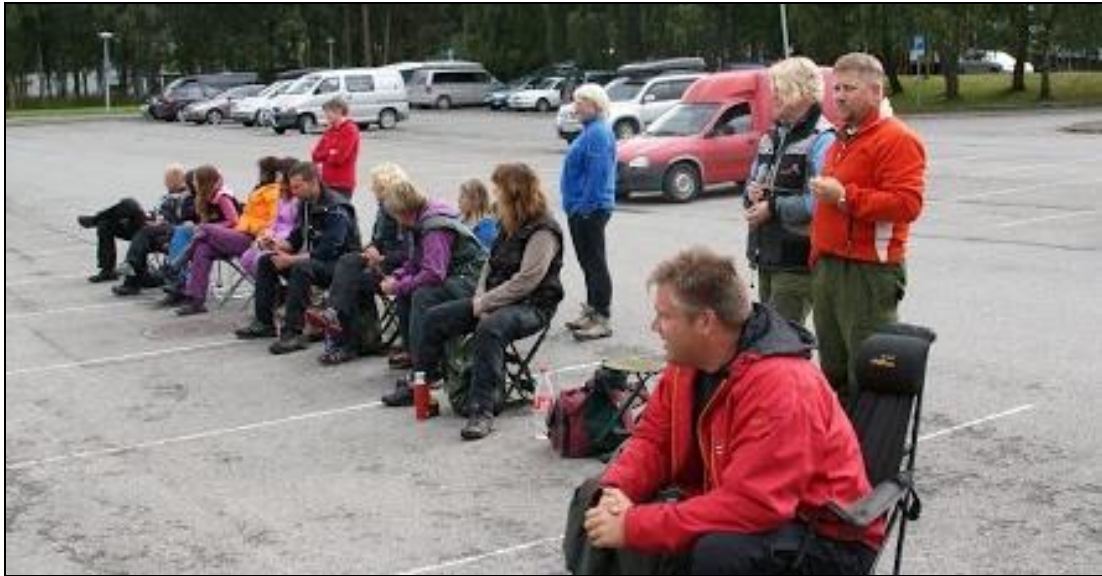
Tilskuere og deltagere