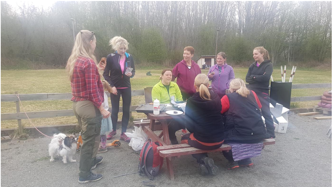
I pausen koste vi oss med hjemmebakte kaker og kaffe

Bjørnar støpte ny fot til bommen inn på parkeringsplassen. Bra jobba!