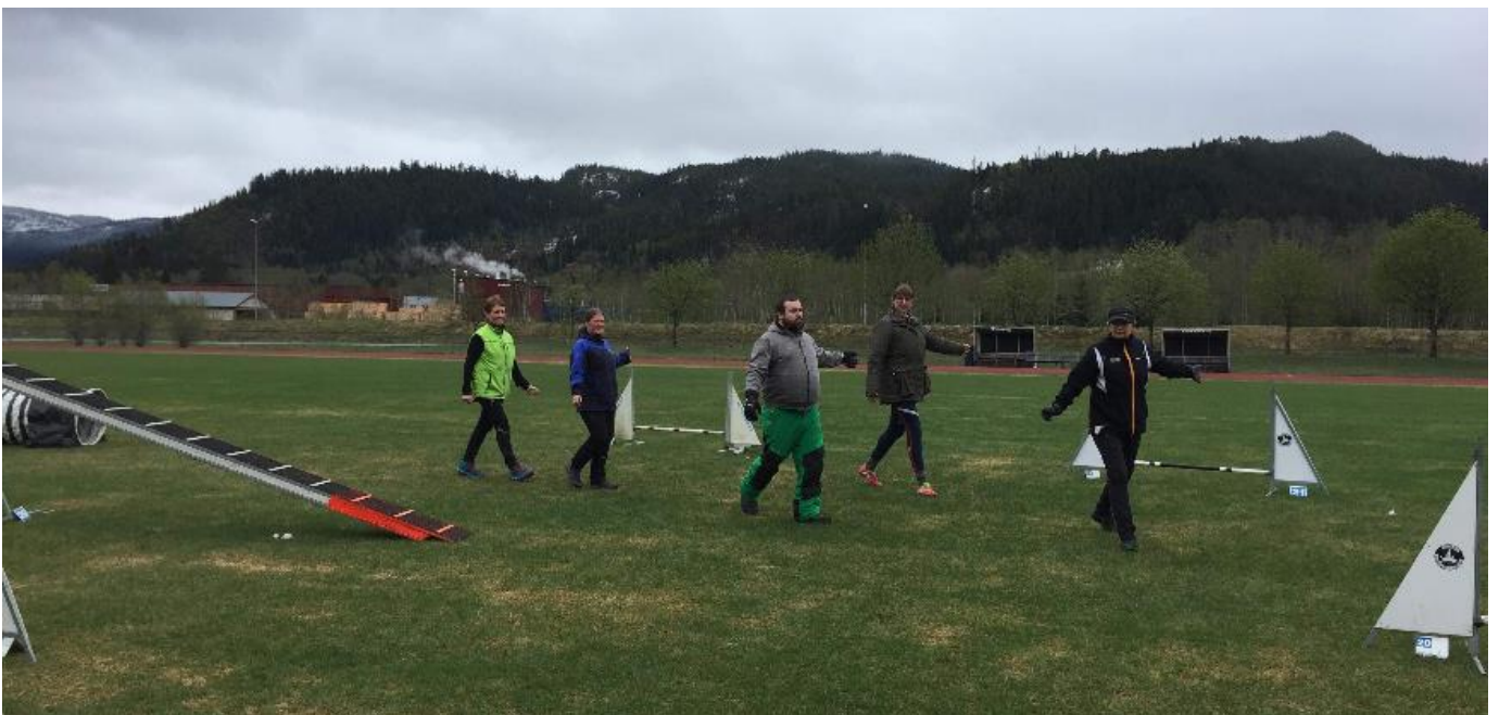
Briefing på gang