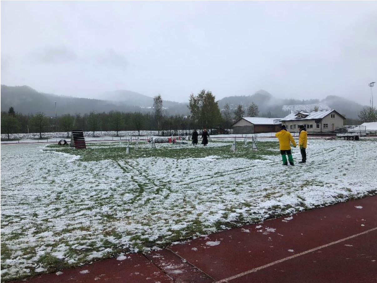
Oppstart lørdag morgen

Kurset fikk en litt tøff start med flere cm snø på gresset, men heldigvis var underlaget på idrettsparken så bra, at dette ikke ble noe problem. Instruktørene bydde på artige og utfordrende baner så både hunder og handlere fikk trimmet seg godt. Flere snakket om blodsmak i munnen :-)