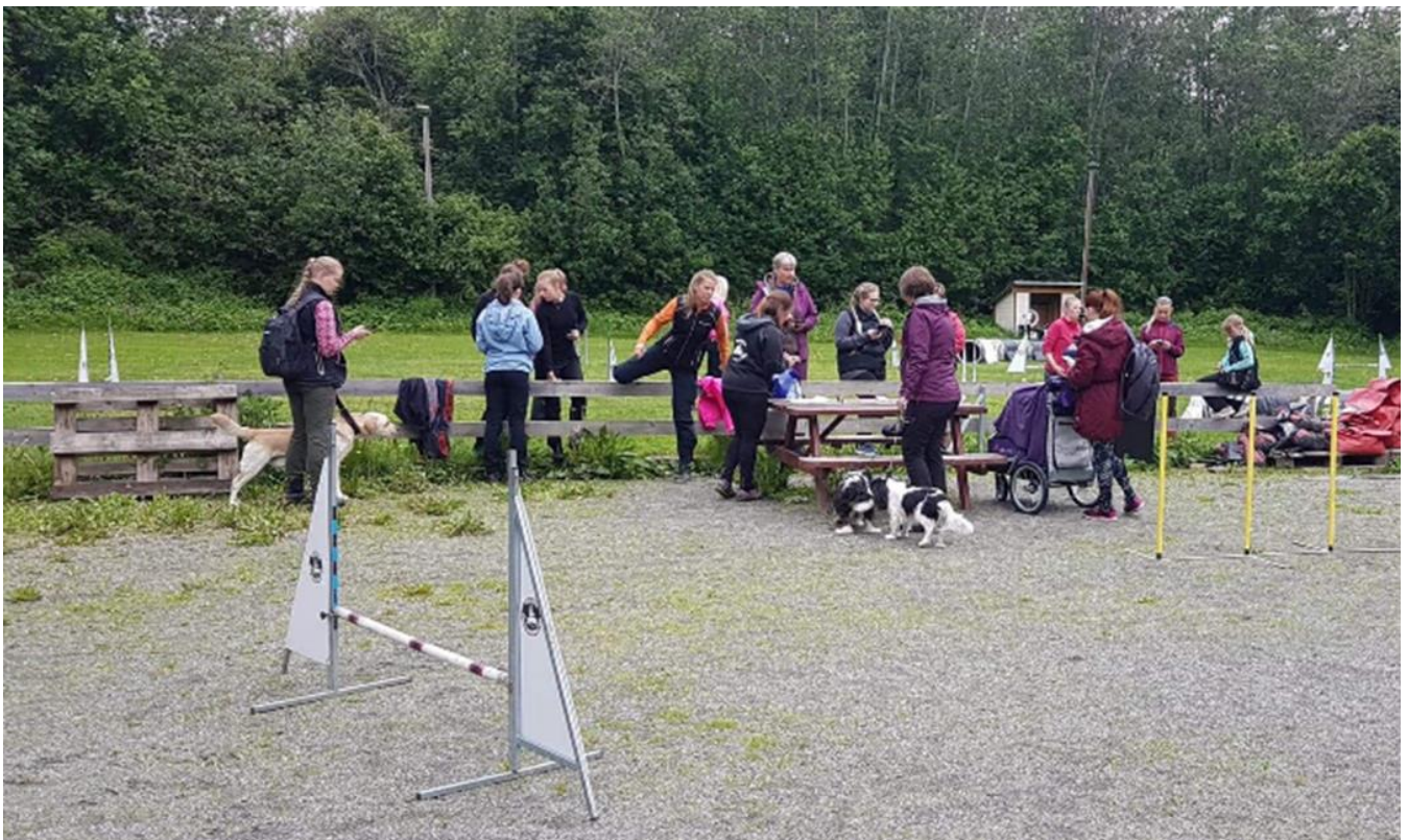
Spente deltakere før oppstart

Neste blåbærkonkurransen blir på slutten av den offisielle konkurransen «Trønderhelga del 2» den 17. - 18. august.