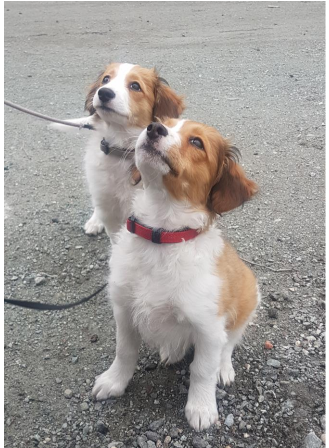
To av de søteste dugnadsdeltakerne

En klubb som Nidaros er avhengig av dugnadsarbeid. Derfor er det svært gledelig at så mange møter opp og tar i et tak til vårt felles beste.